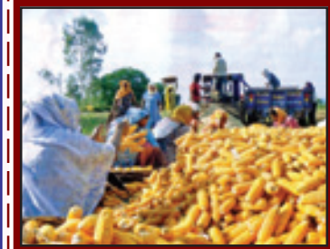
ਸਾਉਣੀ ਦੀ ਇਹ ਫਸਲ ਸੁਨਹਿਰੀ