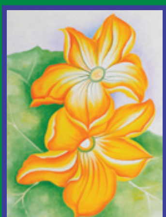
ਚਿੱਤਰਕਾਰ ਜਾਰਜੀਆ ਓ'ਕੀਫੀ ਵੱਲੋਂ ਫੁੱਲਾਂ ਦੇ ਬਣਾਏ ਚਿੱਤਰ।