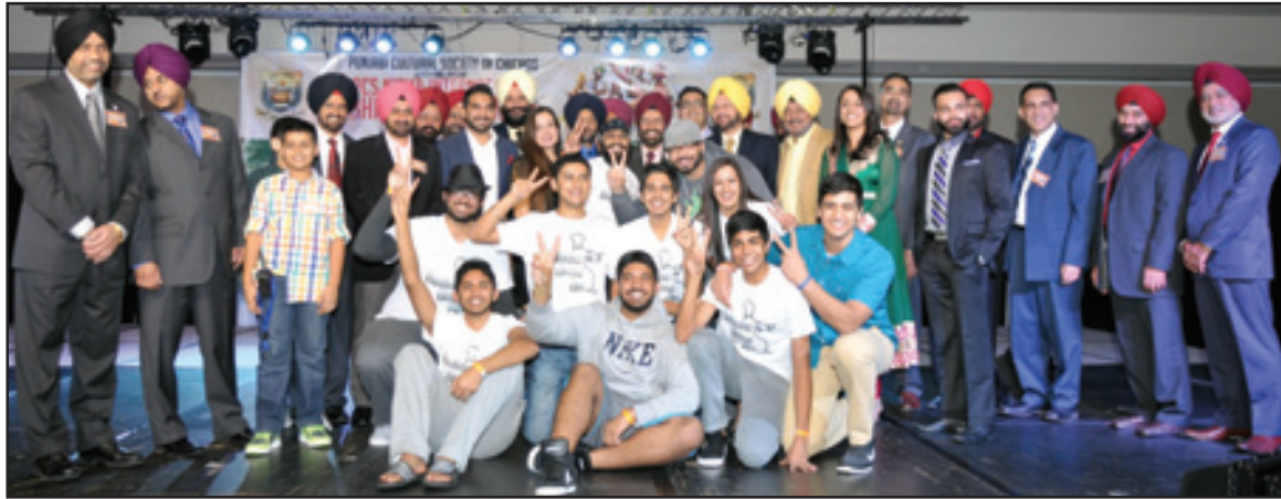
ਮਿਸ਼ੀਗਨ ਦੀ 'ਰਾਖੇ ਵਿਰਸੇ ਦੇ' ਟੀਮ