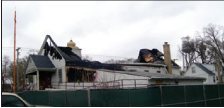
ਗੁਰਦੁਆਰਾ ਗੁਰਜੋਤਿ ਪ੍ਰਕਾਸ਼ ਦੀ ਸੜੀ ਹੋਈ ਇਮਾਰਤ

2010ਆਰ0048635 ਵੀ ਰੱਦ ਕਰ ਦਿੱਤੇ ਹਨ। 22 ਅਕਤੂਬਰ 2010 ਨੂੰ ਮਕੈਨਰੀ ਕਾਉਂਟੀ ਰਿਕਾਰਡ ਆਫ ਡੀਡਸ ਪਾਸ ਦਰਜ ਕਰਵਾਇਆ ਗਿਆ ਲੀਅਨ ਦਾ ਕਲੇਮ ਵੀ ਅਦਾਲਤ ਨੇ ਰੱਦ ਕਰਦਿਆਂ ਕਿਹਾ ਹੈ ਕਿ ਇਹ ਜਾਇਦਾਦ ਹੁਣ