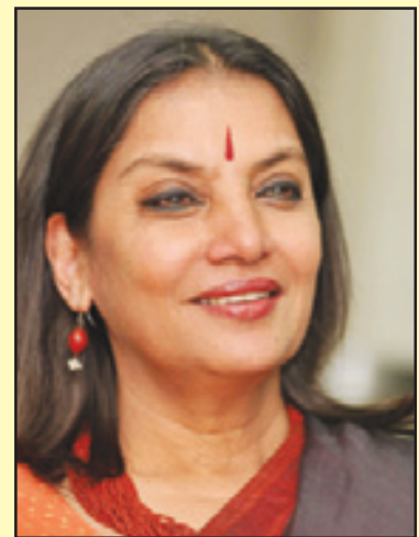
ਸਮਾਜਕ ਸਰਗਰਮੀਆਂ ਨਾਲ ਭਰਿਆ ਪਿਆ ਸੀ। ਕੈਫੀ ਆਜ਼ਮੀ ਅਤੇ ਸ਼ੌਕਤ ਆਜ਼ਮੀ ਇਸ ਲਹਿਰ ਵਿਚ ਬਰਪੂਰ ਯੋਗਦਾਨ ਪਾ ਰਹੇ ਸਨ। ਨਾਟਕਾਂ

1970ਵਿਆਂ ਵਿਚ ਸਾਰਥਕ ਦੀ ਲਹਿਰ ਜ਼ੋਰਾਂ ਜ਼ੋਰਾਂ ਨਾਲ ਚੱਲ ਰਹੀ ਸੀ ਅਤੇ ਆਪਣੀ ਅਦਾ, ਅਦਾਕਾਰੀ ਤੇ ਅੰਦਾਜ਼ ਕਰ ਕੇ ਸ਼ਬਾਨਾ ਆਜ਼ਮੀ ਇਸ ਲਹਿਰ ਦੀਆਂ ਮੂਹਰਲੀਆਂ ਸਫ਼ਾਂ ਵਿਚ ਆ ਗਈ। ਉਸ ਨੇ 'ਨਿਸ਼ਾਂਤ', 'ਫਕੀਰਾ', 'ਸ਼ਤਰੰਜ ਕੇ ਖਿਲਾਤੀ', 'ਜਨੂੰਨ', 'ਸਪਰਸ਼', 'ਅਰਥ', 'ਮੰਡੀ', 'ਖੰਡਹਰ', 'ਪਾਰ' ਵਰਗੀਆਂ ਯਾਦਗਾਰੀ ਫਿਲਮਾਂ ਹਿੰਦੀ ਸਿਨੇਮਾ ਨੂੰ ਦਿੱਤੀਆਂ। ਉਹ ਅੱਜ ਵੀ ਸਿਨੇਮਾ ਨਾਲ ਪਹਿਲਾਂ ਵਾਲੀ ਸੁਹਿਰਦਤਾ ਨਾਲ ਜੁੜੀ ਹੋਈ ਹੈ।