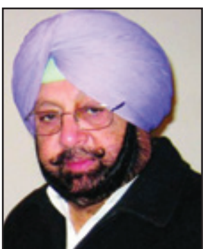
ਕੈਪਟਨ ਅਮਰਿੰਦਰ ਸਿੰਘ

ਅੰਤਿਕਾ: (ਜਬਰੀ ਭਾਰਤੀ ਵਾਰੇ ਪੰਜਾਬੀ ਟੋਟਕਾਂ) ਏਥੇ ਮਿਲਦੀ ਟੁੱਟੀ ਹੋਈ ਜੁੱਤੀ ਓਥੇ ਮਿਲਦੇ ਬੂਟ, ਭਰਤੀ ਹੋ ਜਾਣਾ, ਹੋ ਜਾਣਾ ਰੰਗਰੂਟਾ। ਏਥੇ ਮਿਲਦੇ ਪਾਣੇ ਹੋਏ ਕਪੜੇ ਓਥੇ ਮਿਲਦੇ ਸੂਟ, ਭਰਤੀ ਹੋ ਜਾਣਾ, ਹੋ ਜਾਣਾ ਰੰਗਰੂਟਾ।