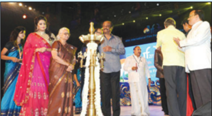
ਫਿਲਮ ਮੇਲੇ ਦੇ ਉਦਘਾਟਨ ਮੌਕੇ ਅਦਾਕਾਰ ਰਜਨੀਕਾਂਤ।

ਅਦਾਕਾਰੀ ਅਤੇ ਜੀਵਨ ਨੂੰ ਪੇਸ਼ ਕਰਦੀ ਦਸਤਾਵੇਜ਼ੀ ਫਿਲਮ ਵੀ ਦਿਖਾਈ ਗਈ। ਇਸ ਫਿਲਮ ਵਿਚ ਰਜਨੀਕਾਂਤ ਦੀ ਜ਼ਿੰਦਗੀ ਦੇ ਨਾਲ-ਨਾਲ ਫਿਲਮ ਸਨਅਤ ਦਾ ਸਮੁੱਚਾ ਇਤਿਹਾਸ ਸਮੋਇਆ ਪਿਆ ਸੀ।