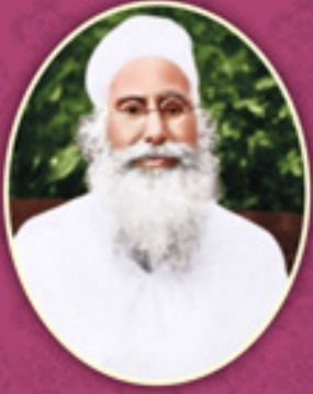
Sant Attar Singh Ji (1866 – 1927)

ਦਿਹ ਰੈ ਪ੍ਰਗਟ ਹਮਾਰੀ ਕਾਸੀ। ਪੜ੍ਹੋ ਦਿਹਾਂ ਚੋਰ ਮਤਿਰਾਸੀ। ਲੇਖਕ ਗੁਰੀ ਕਵਿੰਦ ਗਿਆਨੀ। ਬੁੱਧਿਸਿੰਧੁ ਹੋਰੋ ਦਿਤ ਆਨੀ॥ (Ret:- Mahan Kosh by Bhai Kahan Singh 'Nabha')