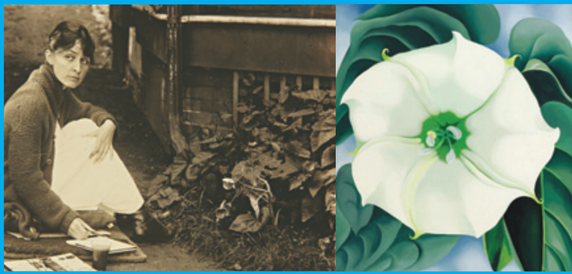
ਕਿਰਤ ਵਿਚ ਰੁੱਝੀ ਜਾਰਜੀਆ ਓ'ਕੀਫੀ ਅਤੇ (ਸੱਜੇ) ਜਿਮਸਨ ਵੀਡ/ਵਾਈਟ ਫਲਾਵਰ ਨੰਬਰ 1 ਦੀ ਤਸਵੀਰ।

ਅਮਰੀਕੀ ਚਿੱਤਰਕਾਰ ਜਾਰਜੀਆ ਓ'ਕੀਫੀ ਦੀ ਫੁੱਲ ਵਾਲੀ ਪੇਂਟਿੰਗ ਨੇ ਕਮਾਈ ਦੇ ਪੱਖ ਤੋਂ ਰਿਕਾਰਡ ਬਣਾ ਦਿੱਤਾ। ਉੱਜ, ਇਹ ਰਿਕਾਰਡ ਸਿਰਫ ਔਰਤ ਚਿੱਤਰਕਾਰਾਂ ਦੇ ਪ੍ਰਸੰਗ ਵਿਚ ਹੈ। ਇਹ ਪੇਂਟਿੰਗ 44.4 ਮਿਲੀਅਨ ਡਾਲਰ ਵਿਚ ਵਿਕੀ ਹੈ। ਇਸ ਤੋਂ ਪਹਿਲਾਂ ਜੌਨ ਮਿਸ਼ੇਲ ਦੀ ਪੇਂਟਿੰਗ ਪਿਛਲੀ ਮਈ ਦੌਰਾਨ ਰਿਕਾਰਡ 11.9 ਮਿਲੀਅਨ ਡਾਲਰ ਦੀ ਵਿਕੀ ਸੀ। ਅਸਲ ਵਿਚ ਓ'ਕੀਫੀ ਦੀ ਪੇਂਟਿੰਗ ਦੀ ਨਿਲਾਮੀ ਮੌਕੇ 2 ਬੰਦਿਆਂ ਵਿਚਕਾਰ ਮੁਕਾਬਲਾ ਚੱਲ ਪਿਆ ਅਤੇ ਇਹ ਪੇਂਟਿੰਗ ਜਿਸ ਦੀ ਕੀਮਤ ਦਾ ਅੰਦਾਜ਼ਾ 15 ਮਿਲੀਅਨ ਡਾਲਰ ਲਾਇਆ ਗਿਆ ਸੀ, 3 ਗੁਣਾ ਵੱਧ ਭਾਅ ਉਤੇ ਵਿਕ ਗਈ। ਓ'ਕੀਫੀ ਦੀ ਇਸ ਪੇਂਟਿੰਗ ਦਾ ਨਾਂ 'ਜਿਮਸਨ ਵੀਡ/ ਵਾਈਟ ਫਲਾਵਰ ਨੰਬਰ 1' ਹੈ ਅਤੇ ਇਸ ਦੀ ਨਿਲਾਮੀ ਨਿਊ ਮੈਕਸੀਕੋ ਵਿਚ ਸਥਿਤ ਓ'ਕੀਫੀ ਮਿਊਜ਼ੀਅਮ ਨੇ ਕੀਤੀ ਸੀ। ਓ'ਕੀਫੀ ਨੇ ਇਹ ਪੇਂਟਿੰਗ 1932 ਵਿਚ ਬਣਾਈ ਸੀ।