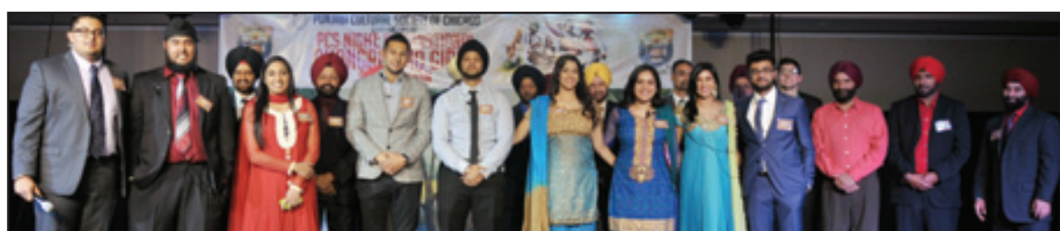
ਸੁਸਾਇਟੀ ਦੀ ਯੂਥ ਟੀਮ ਦੇ ਮੈਂਬਰ

ਭਾਵੇਂ ਇਨ੍ਹਾਂ ਵਿਚ ਸਾਰੇ ਪੰਜਾਬੀ ਨਹੀਂ ਸਨ ਪਰ ਇੱਕ ਗੱਲ ਖਾਸ ਸੀ ਕਿ ਇਸ ਟੀਮ ਵਿਚ 2 ਮੁੰਡਿਆਂ ਨੂੰ ਛੱਡ ਕੇ ਬਾਕੀ ਜ਼ਿਆਦਾ ਹਾਈ ਸਕੂਲ ਵਿਚ ਪੜ੍ਹਦੇ ਬੱਚੇ ਸਨ। ਇੱਕ ਹੋਰ ਗੱਲ ਸੰਜੋਗ ਕਹੀ ਜਾ ਸਕਦੀ ਹੈ ਪਰ ਧਿਆਨ ਦੇਣ ਵਾਲੀ ਜ਼ਰੂਰ ਹੈ ਕਿ ਪਹਿਲਾ ਇਨਾਮ ਪਾਉਣ ਵਾਲੀ 'ਮਨਿਸਟਰ ਆਫ ਭੰਗੜਾ' ਟੀਮ ਦੇ ਦੋ ਖਿਲਾਤੀ