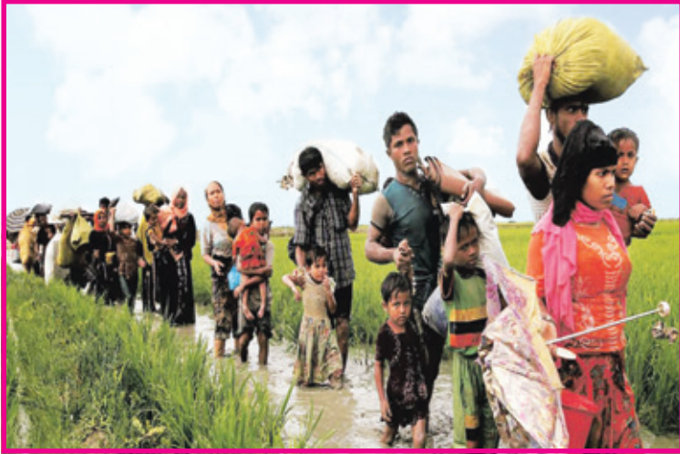
ਉਜੜੇ ਰੋਹਿੰਗੀਆ ਦਾ ਕਾਫਲਾ।